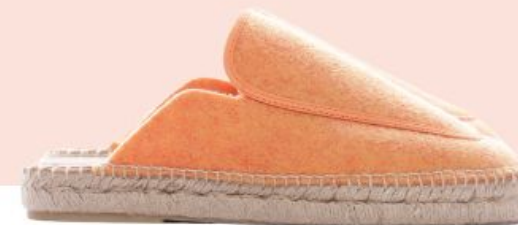
Pare Gabia, 95€