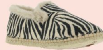
Maison de l'Espadrille, 41€