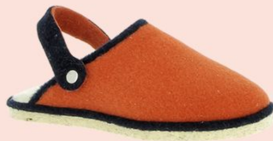
Chic Easy, 42€