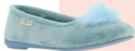
Maison de l'Espadrille, 26€

Cet hiver, le chausson s'offre la ballerine et convertit la chaussure de danse en accessoire cocooning. Une ballerine pour la maison que les créateurs déclinent en version velours et à pompon chez La Maison de l'Espadrille , en mode moumoute chez Chausse Mouton , ou tout velours et surmontée d'un nœud scintillant chez Exquise . Dans un autre genre, tout aussi élégant, les créateurs français du chausson s'inspirent du traditionnel mocassin pour proposer son versant maison. Heller l'aime en croûte de cuir et velours sur semelle gomme, Volubilis en version cuir de chèvre et velours et Javerflex à la mode fourrée et montagnard.