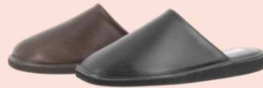
La Vague, 45€