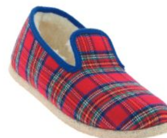
Chausse Mouton, 46.90 €

Effet confinement ou pas, la pantoufle de papy, sachant réchauffer les petons, séduit toujours. Surfant sur les classiques, Chausse Mouton et Javerflex optent pour un tartan écossais à carreaux à l'allure doucement nostalgique. Plus contemporaine, la pantoufle de Sobask joue le blanc chic et douillet, et celle de La Vague affiche son esprit créatif en réinterprétant le carreau à sa manière.