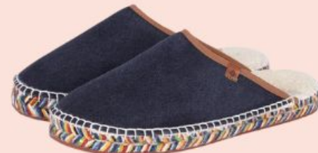
Don Quichosse, 59€