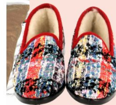
La Vague, 50€

Effet confinement ou pas, la pantoufle de papy, sachant réchauffer les petons, séduit toujours. Surfant sur les classiques, Chausse Mouton et Javerflex optent pour un tartan écossais à carreaux à l'allure doucement nostalgique. Plus contemporaine, la pantoufle de Sobask joue le blanc chic et douillet, et celle de La Vague affiche son esprit créatif en réinterprétant le carreau à sa manière.