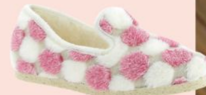
Chic Easy, 39€