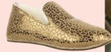
Bosabo, 90 €