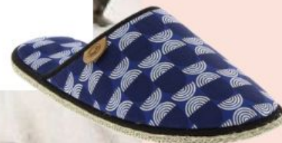
Chausse Mouton, 43.90€

Dans la grande famille des chaussons, le modèle star de l'hiver s'appelle : la mule. Très à l'aise tout l'été, à la plage comme en bord de mer, la mule réchauffe aussi les pieds cet hiver et les créateurs français du chausson s'en donnent à cœur joie. On la choisit cette saison en version cuir et profilée chez La Vague , minimale en coton sergé avec Pauljac , tout en fourrure et l'esprit cocooning dans l'allure chez Sobask et Javerflex , avec un effet matelassé dans les collections signées Chic Easy . Elle prend des airs arty et ethniques avec Chausse Mouton et graphique chez Don Quichosse qui revisite sa semelle espadrille.