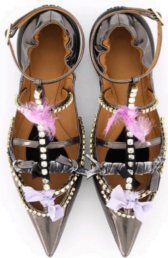
Tootsy Specchio, 750€