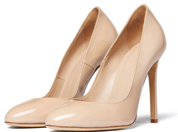
Nude patent pumps, 445€