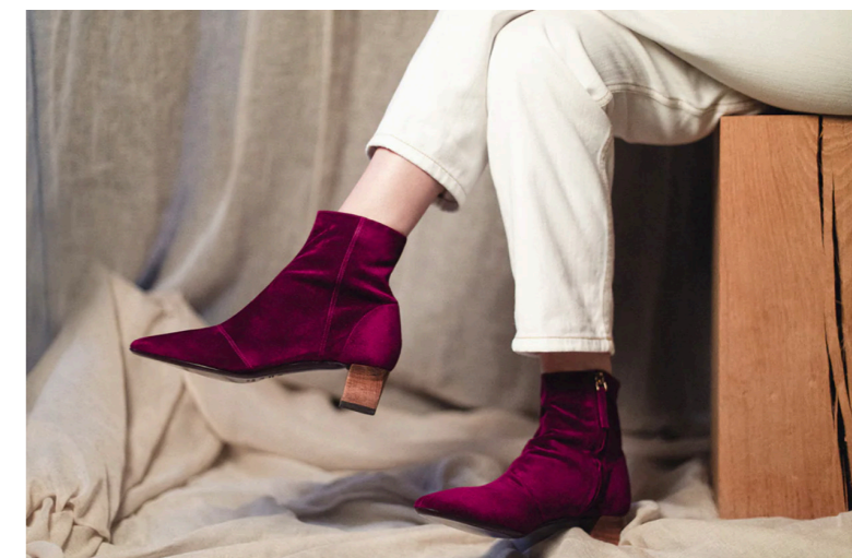
Boots Velours N. 006, 550€