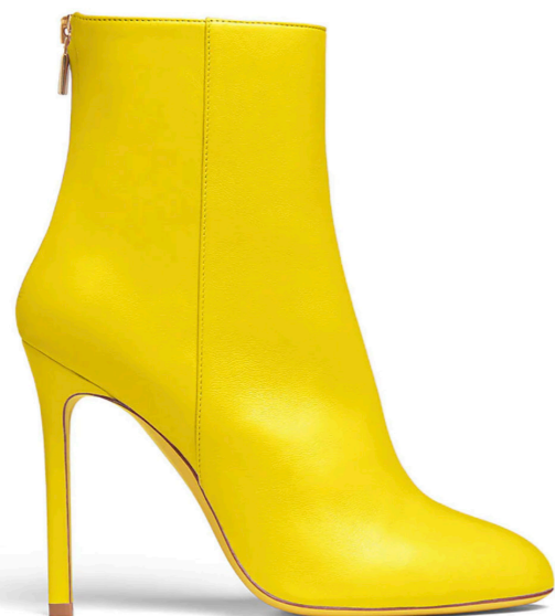
Yellow ankle boots, 655€

Les chaussures Kendrick sont disponibles en pré-commande sur le site kendrick.paris ainsi qu'à la Ravonn Gallery, 4 rue Montesquieu, Paris 1er.