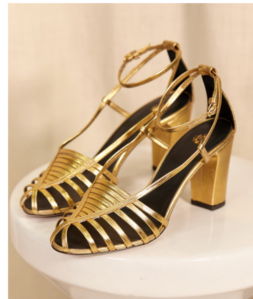
Sandales Audrey, 235€