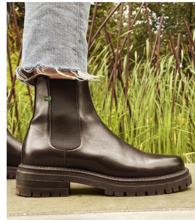
Chelsea Boot Jerry, 165€