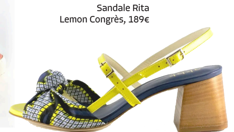
Sandale Rita Lemon Congrès, 189€