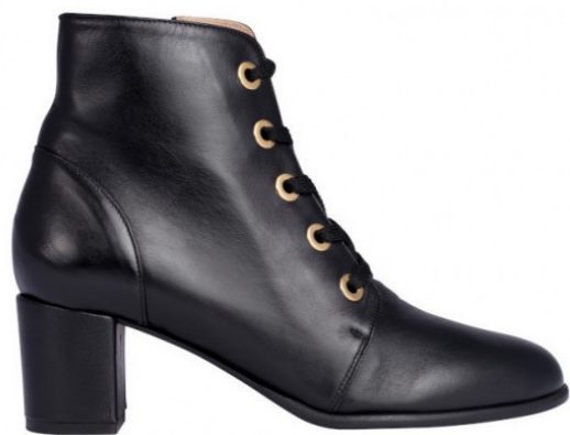
Suzie Black, 195€

Détail qui fait la différence : les chaussures Emzi s'adaptent à tous les pieds, même les plus petits, en commençant dès la pointure 33. Prônant le luxe accessible, elles sont vendues sur l'e-shop www.mz-shoes.com et dans le cadre de pop-up stores.