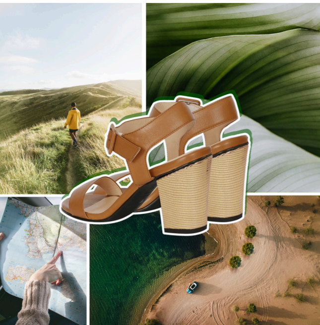
Sandales Mafate, 169€