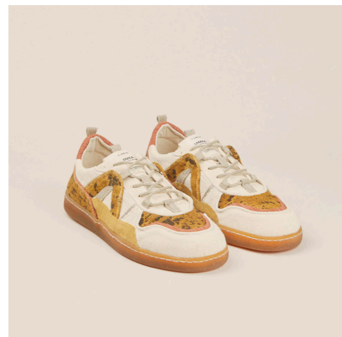
Baskets MMEA, 249€

Baptisé MMEA, la dernière sneaker proposée en pré-commande (sur la plateforme de financement participatif, Ulule) remporte un vif succès avec 1105 paires commandées. Un modèle à retrouver sur l'e-shop de la marque www.umoja-shoes.com et dans une sélection de revendeurs à Paris (chez Saargale, Bleu Tango...), aux Etats-Unis, en Suisse, en Côte d'Ivoire et au Burkina Faso.