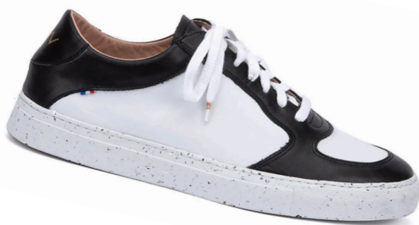
Paul bicolore, 155€