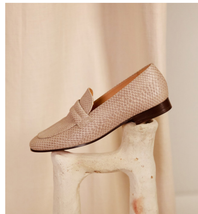
Mocassin Perrine, 255€

Des chaussures à retrouver sur leur eshop www.estreamis.fr et sur les marketplaces www.wedressfair.fr et www.dreamact.eu , et prochainement dans la première boutique parisienne Être Amis.