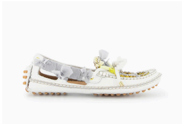
Medusa White, 490€