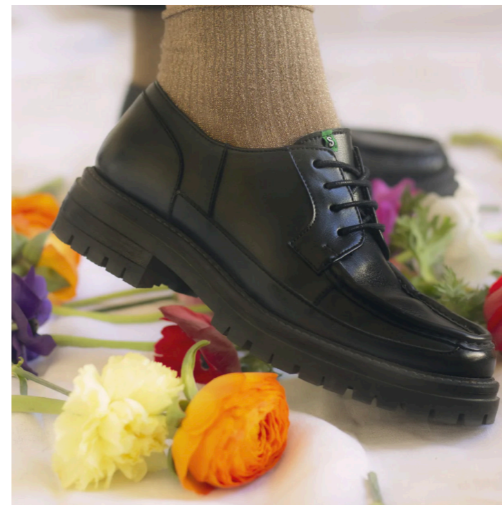
Derby Dolly, 145€

Les chaussures Supergreen sont en vente, en précommande, sur l'eshop www.supergreenshoes.fr