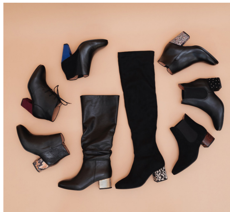
Bottines & bottes, à partir de 189€