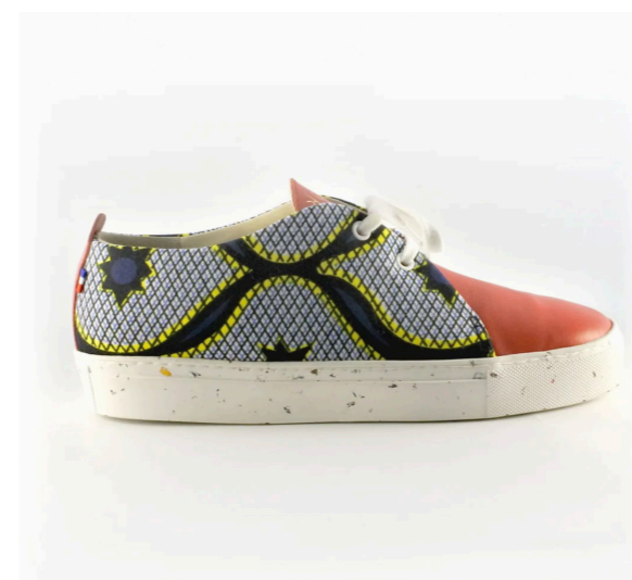
Sneaker Gaïa Losange Congrès, 149€

Des créations uniques vendues sur l'eshop de la marque www.akbkcreations.fr et en dépôt-vente à « Le vestiaire Bordelais » quartier des quais à Bordeaux.