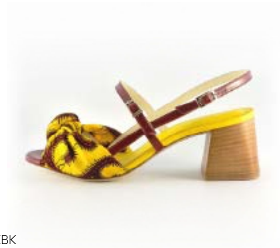
FFC / AKBK SANDALES RITA, 249€