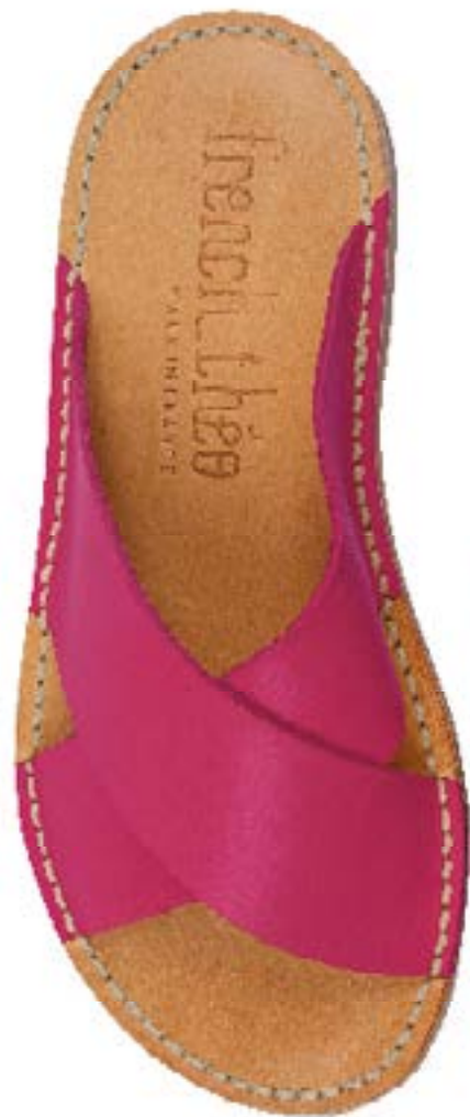
FFC / FRENCH THEO MAXIME FUCHSIA, 175 €