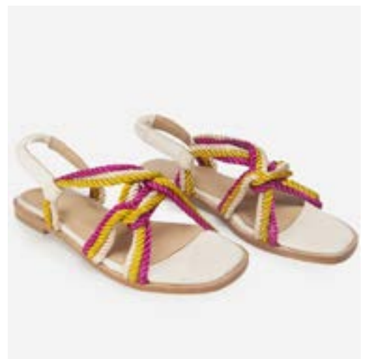
FFC / ANAKI SANDALES DINA FUSHIA, 129 €