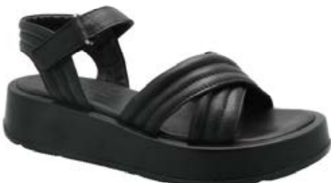
FFC / ADIGE BY. BAYA- V2 NAP BLACK, 99€