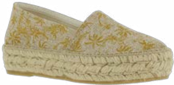
FFC / LA MAISON DE L'ESPADRILLE BORA, 47

Ailleurs, les créateurs prennent toutes les libertés. Anthology décline l'imprimé croco sur une paire de mocassin, Azurée et Socque le serpent et Anaki le léopard sur leurs sandales à talons. Akbk réchauffe enfin l'été autour d'un tissu wax jaune éclatant.