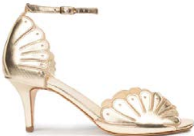
FFC / CHAMBERLAN SANDALES CABOURG CHAMPAGNE, 495 €