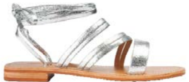
FFC / COULEUR POURPRE SANDALES SARDAIGNE, 89€