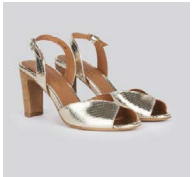
FFC / ANTHOLOGY AILY, 245 €