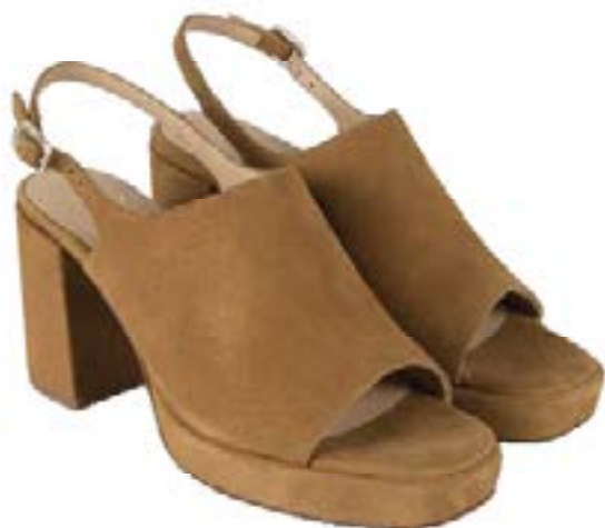
FFC / ANAKI