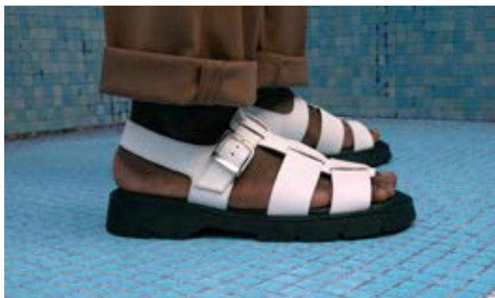
FFC / KLEMAN BALLAST VGT, 150€