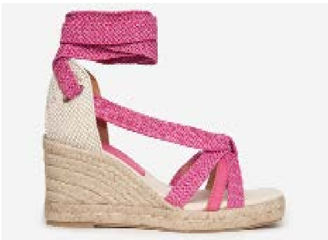
FFC / ANAKI ESPADRILLES BRITANNY, 129 €

Star de la nuit des temps, portée par les tragédiennes grecques, adouées par Roger Vivier dans les années 30 puis vénérées par les hippies à patte d'éph', la sandale plateforme regagne saison après saison ses lettres de noblesse, et fait gagner des centimètres. Cet été, la maison Clergerie la décline XXL et en raphia, Regard en semelle à corde, Anne Blum la préfère en crêpe et Adige en monochrome noir et cuir.