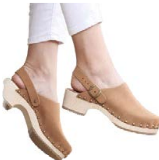
FFC / BOSABO SABOT CERISE, 135 €