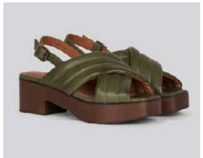
FFC / ANTHOLOGY PRAIA VERT, 275 €