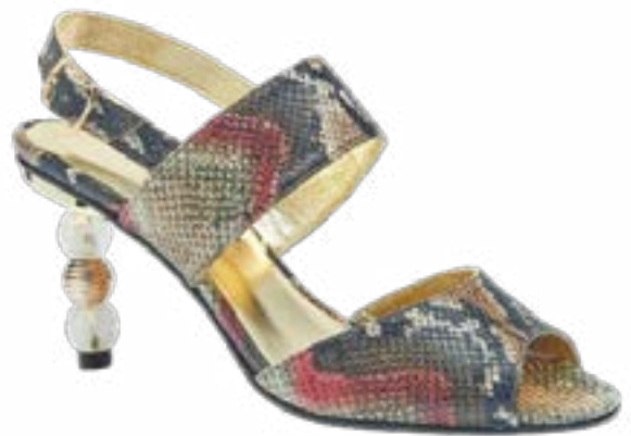
FFC / AZUREE