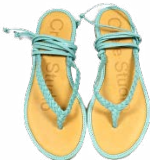
FFC / CRAIE STUDIO