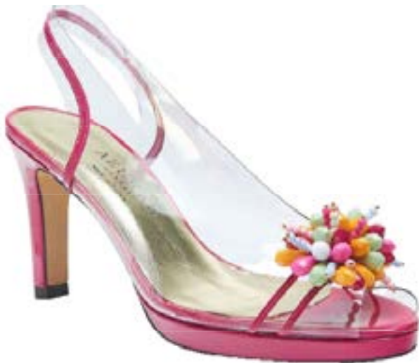
FFC / AZUREE MOCALI, 197 €

Parfois nostalgique, le rose rappelle les années 60, les robes vichy de Brigitte Bardot et le rose bonbon Barbie. Un air rétro qui s'invite dans les collections babies de Begum , les sandales à talons Emzi ou sur les sandales en raphia à pompon rose signées Baglerina . Poudrée, la sandale à talon MZ Shoes ajoute une note de velours et de sensualité.