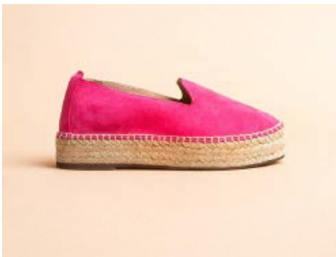
FFC / ESCADRILLE TAORMINA