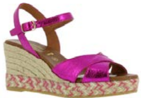
FFC / LA MAISON DE L'ESPADRILLE 878 Fuxia, 99€