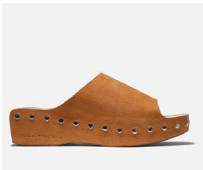
FFC / CLERGERIE MULES TARO, 395 €