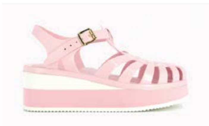
FFC / MEDUSE SUNRISE ROSE PASTEL, 99.90€