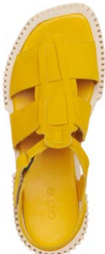
FFC / ARCHE SANDALES IXORRY, 250€

Surfant sur la tendance confort à tout prix, la « sandale à papa » ou « dad sandal » s'invitera aussi sur les plages, associée à une semelle large et sport chez Anne Blum ou Pedigirl , toujours crantée et tout-terrain.