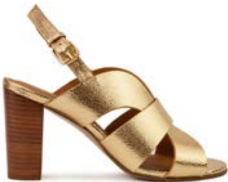
FFC / RIVECOUR SANDALES N.55, 210 €

Objet de toutes les fascinations, la sandale dorée s'impose toujours en grand classique du vestiaire, ainsi des modèles de sandales plates signées Être Amis à celles à talons des maisons Rivecour et Anaki . Enfin, le bronze s'impose en arbitre chez Clergerie , signant, peut-être, le prochain tube de l'été.