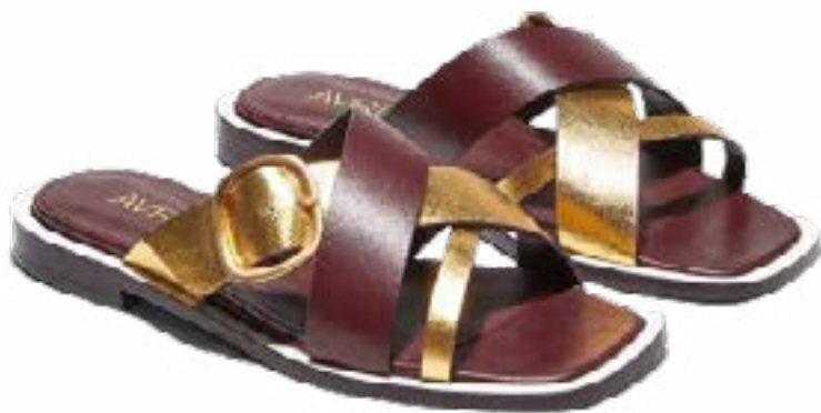
FFC / AVRIL GAU MULES RHUM, 285 €

Hybride, la mule trouve enfin de nouvelles déclinaisons. Mariant parfaitement le mocassin à la mule traditionnelle, le « mulcassin » est la nouvelle originalité de la saison, un style relaxé et chic en même temps à découvrir dans les collections Anthology tout l'été.