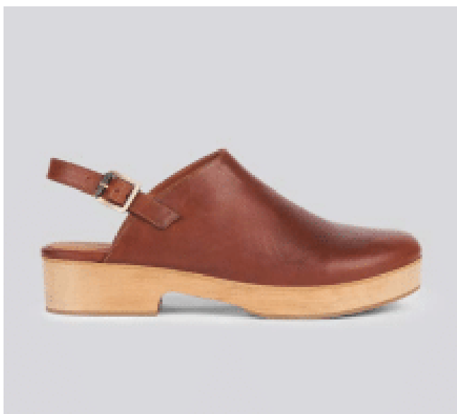
FFC / ANTHOLOGY ELBA

Ajoutant la touche de grâce et de féminité, le sabot à talon est le nouveau it de l'été. Anthology l'adopte en couleur bleue, Anaki camel ou vert électrique. Et Bosabo lui offre une robe fendue sur le devant au jaune ensoleillé.