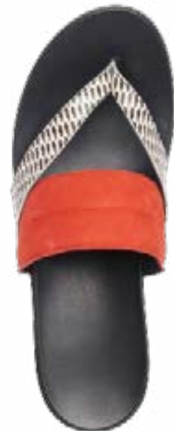
FFC / ARCHE MULES MYAMYA, 230 €